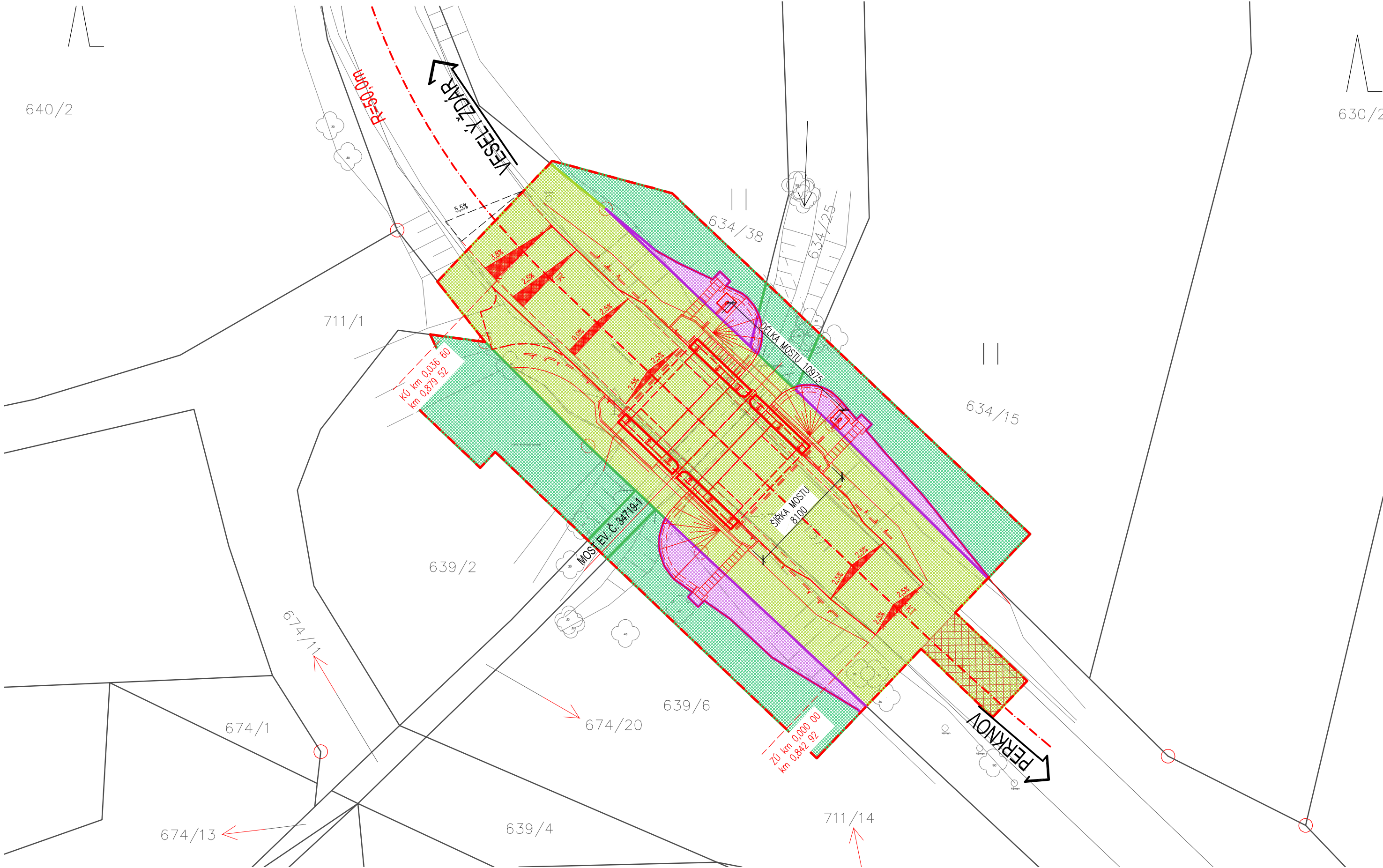
k.ú. Perknov [637955]